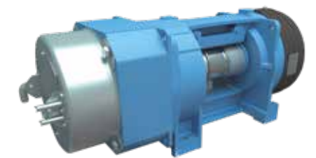
Máxima suavidad al arrancar y parar el ascensor